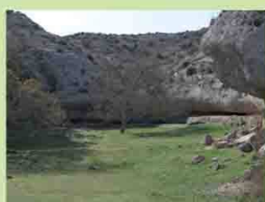
Clot del Círer (B. Roig).