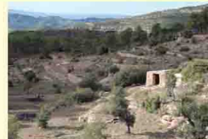
Itinerari de pedra seca (J. Sabater).