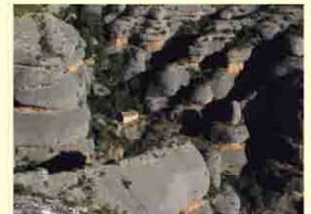
Ermita de Sant Bartomeu (D. Iturria).