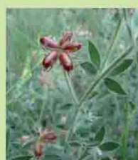
Dorycnium hirsutum i Glaucium flavum (M. Montané).