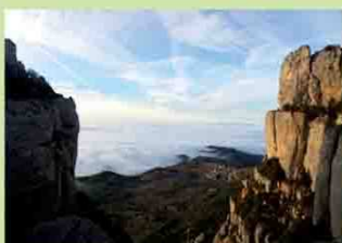
La Morera de Montsant (M. Montané).