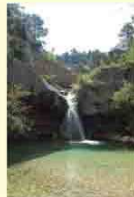
Toll de l'Ou (B. Roig).