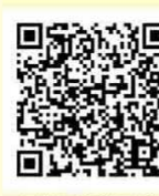
Enllaç als itineraris