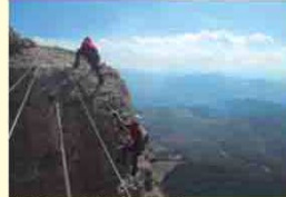
Via Ferrada (M. Montané).